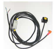
Auto/Car : ALIM 106

12 v battery (+): Blue wire - 0 v battery (ground -): Black wire