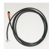
Moto/Bike : ALIM 206